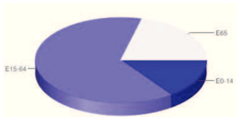
Grafico 2: Indice di vecchiaia (distribuzione per fasce d'età)