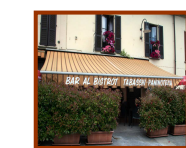
Bar Al Bristrot Castiglione Olona

GLI ORGANIZZATORI DECLINANO OGNI RESPONSABILITA' PER DANNI SUBITI O ARRECATI A COSE E/O PERSONE DURANTE L'ESCURSIONE IN BICICLETTA & MOUNTAIN BIKE AGLI ESCURSIONISTI VERRA' RICHIESTO LA COMPILAZIONE UN MODULO D'ISCRIZIONE PER LO SCARICO DI RESPONSABILITA' E' CONSIGLIATO ABBIGLIAMENTO ADEGUATO, ALLA PRATICA DI ATTIVITA' SPORTIVE IN CASO DI MALTEMPO LA MANIFESTAZIONE SARA' RINVIATA ALLA DOMENICA SUCESSIVA