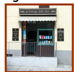
La Bottega delle Idee Castiglione Olona