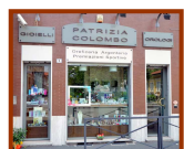
Patrizia Colombo Fagnano Olona