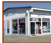
JOLI bebe Cairate