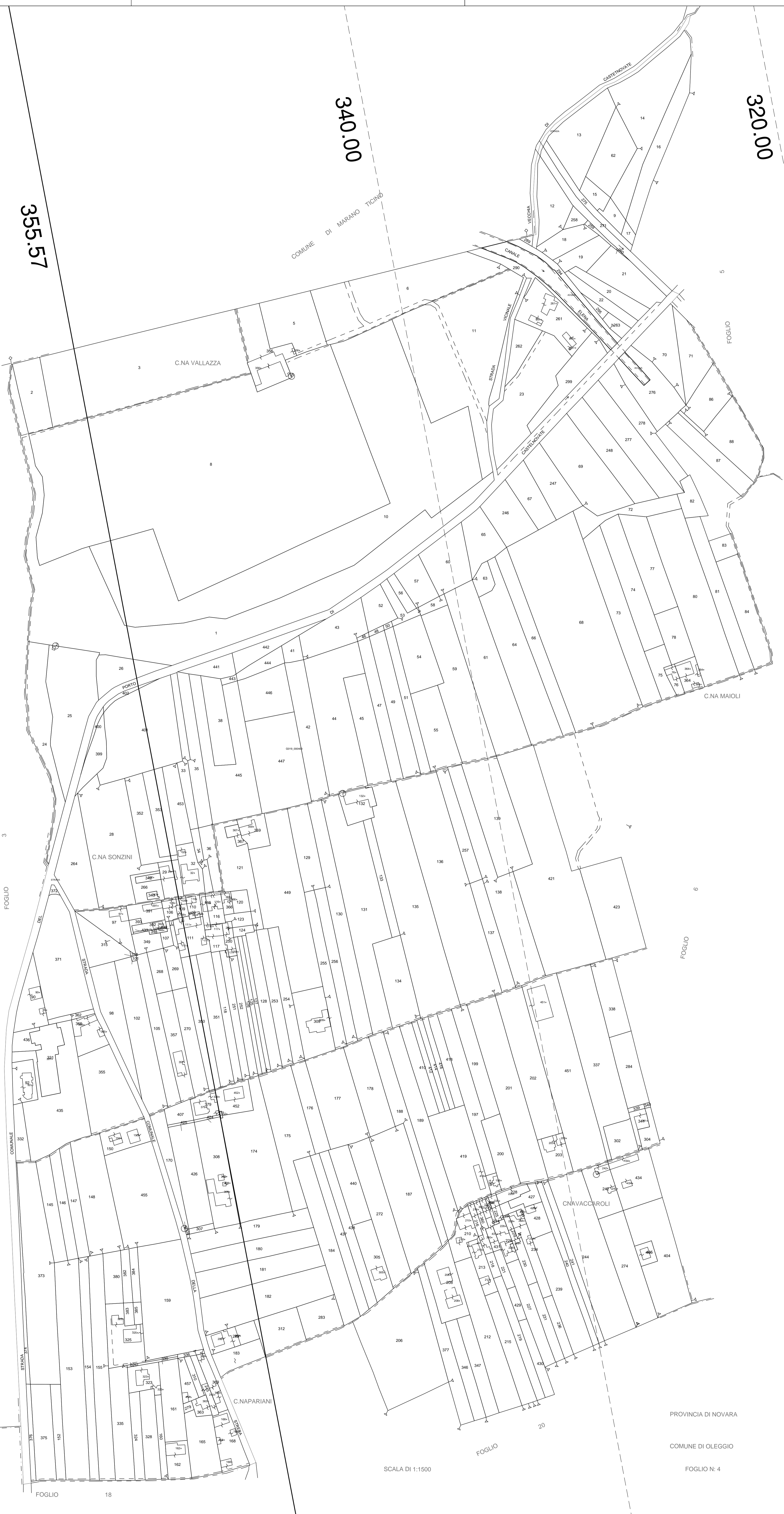
QUADRO D'UNIONE COMUNE