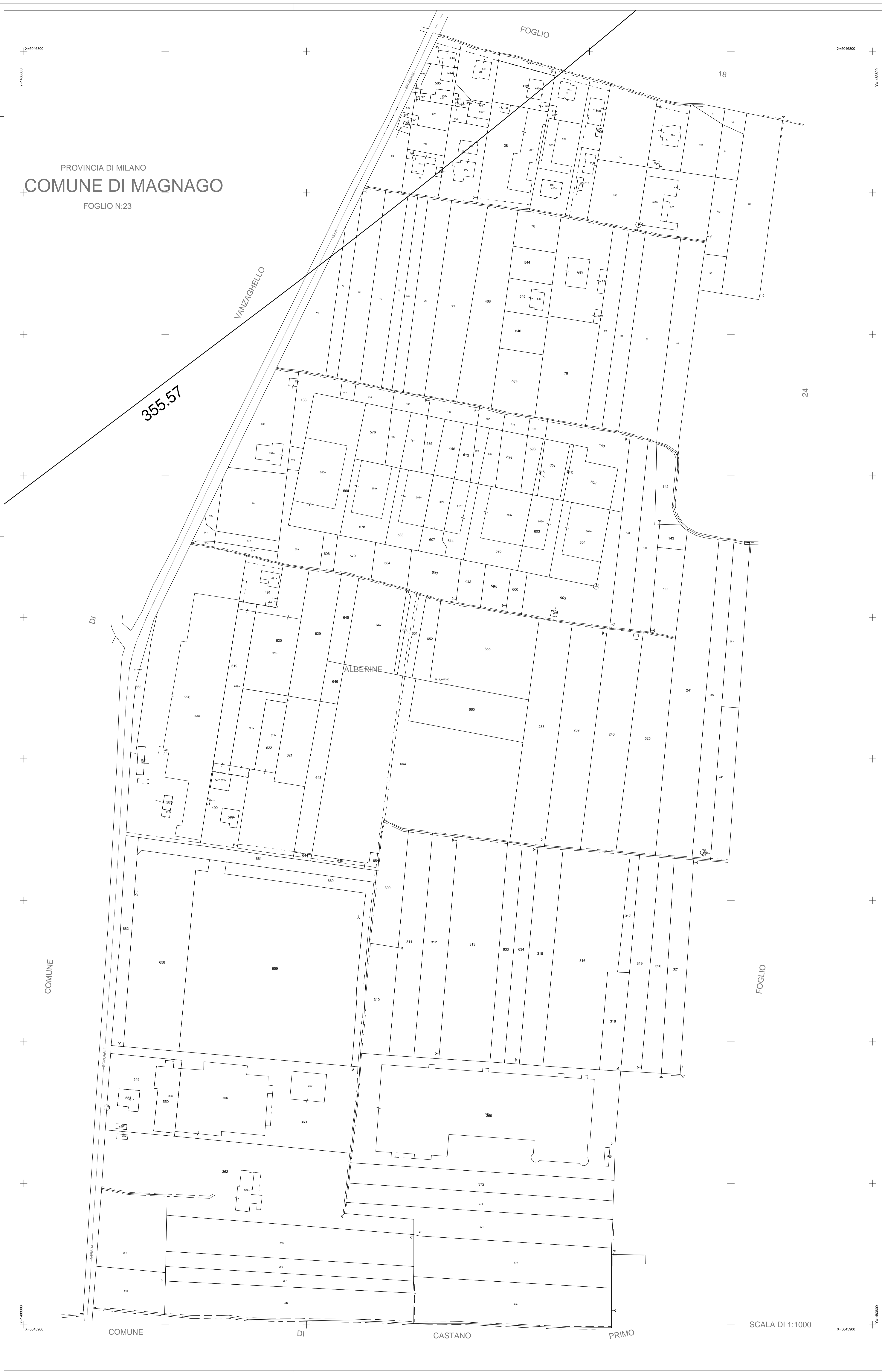
QUADRO D'UNIONE COMUNE

PROVINCIA DI MILANO COMUNE DI MAGNAGO FOGLIO N:23