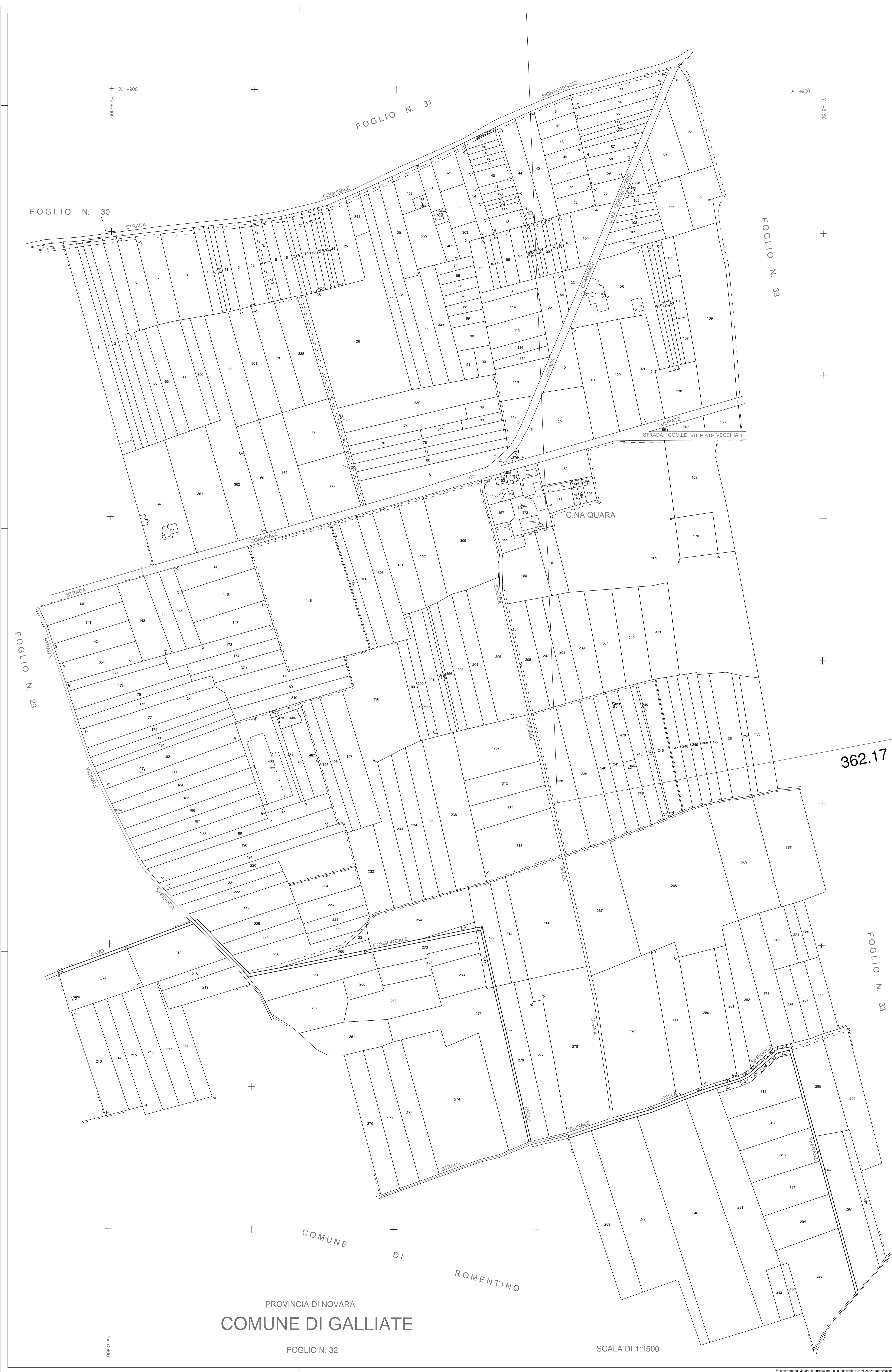
QUADRO D'UNIONE COMUNE