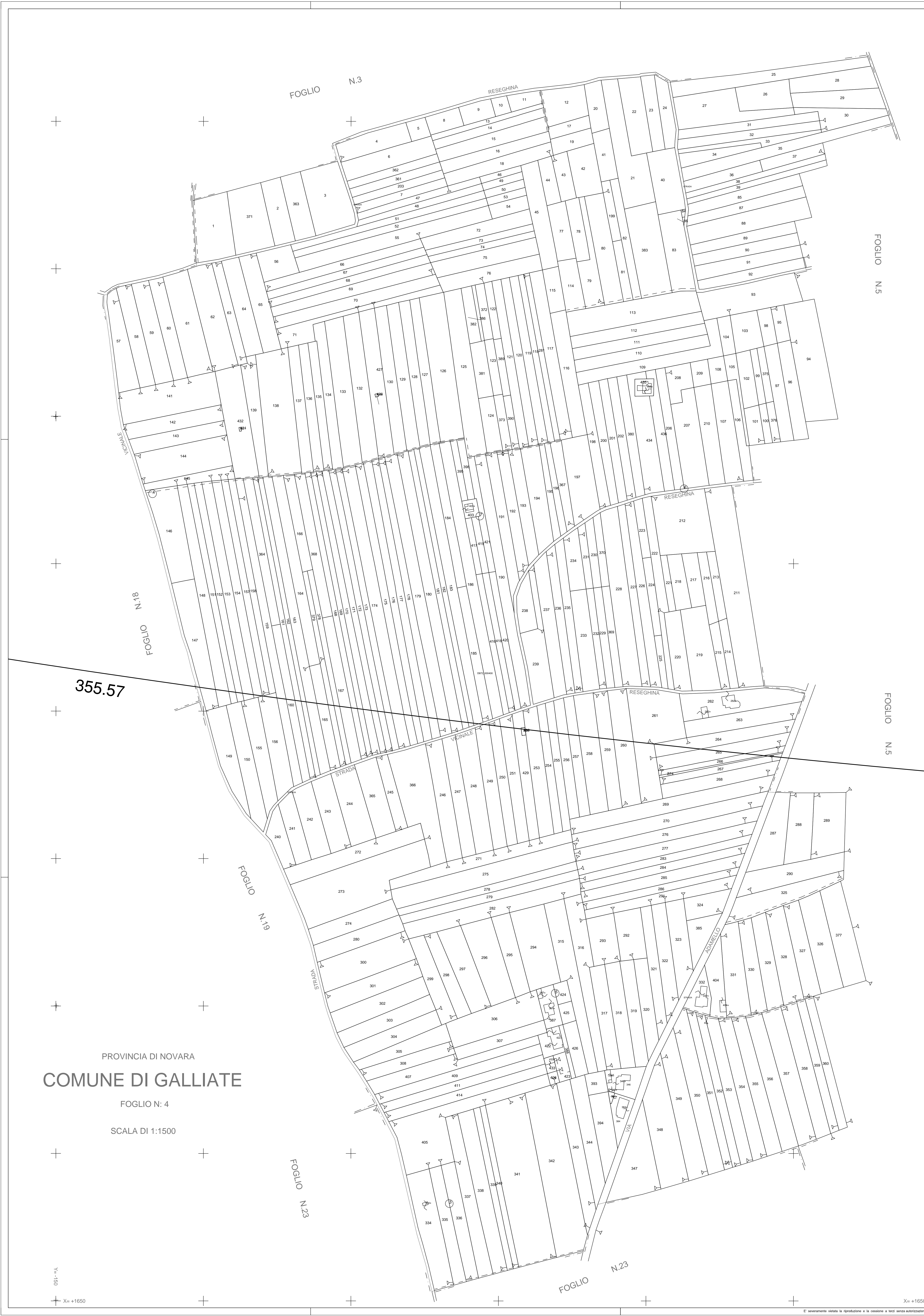
QUADRO D'UNIONE COMUNE