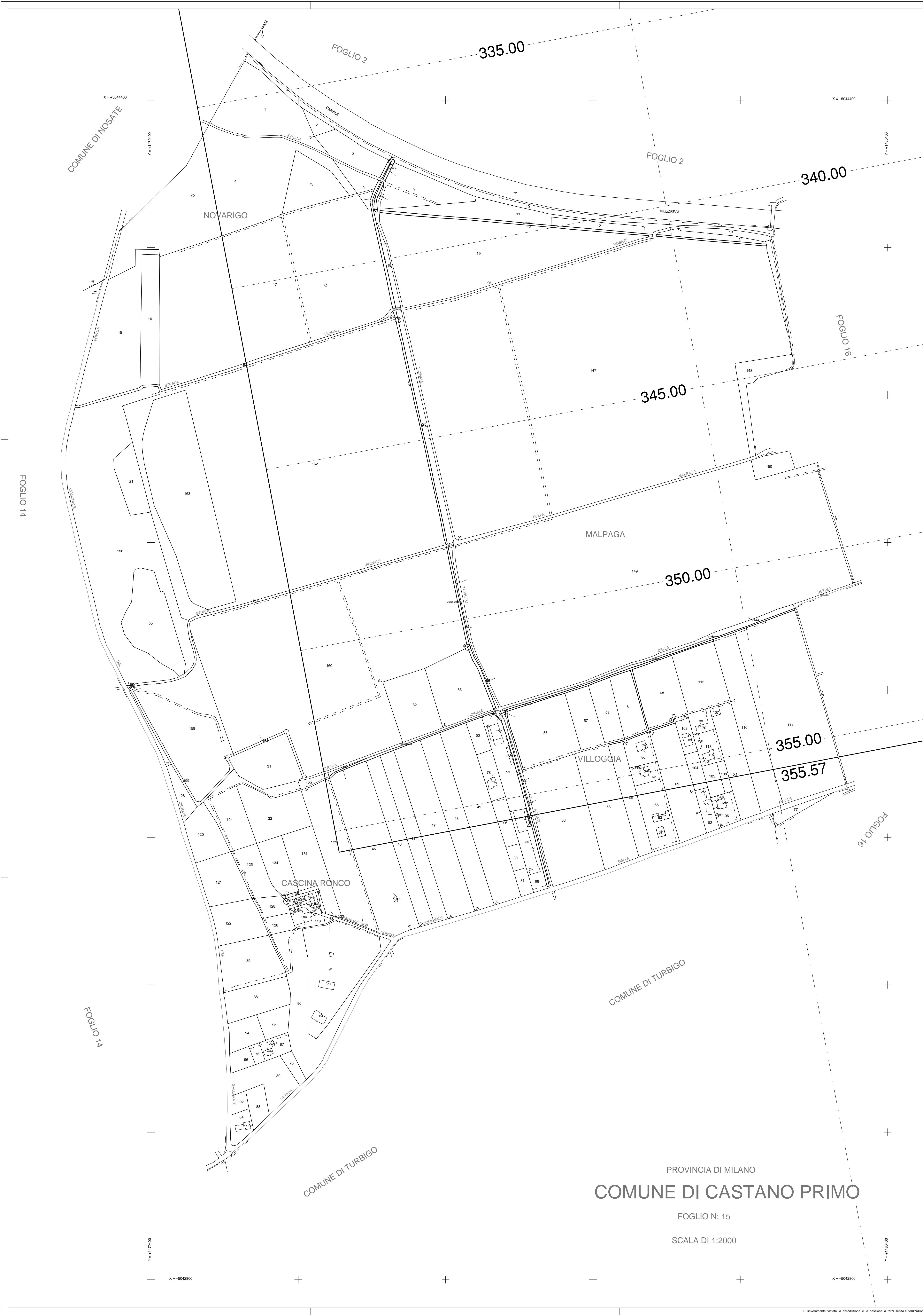
QUADRO D'UNIONE COMUNE