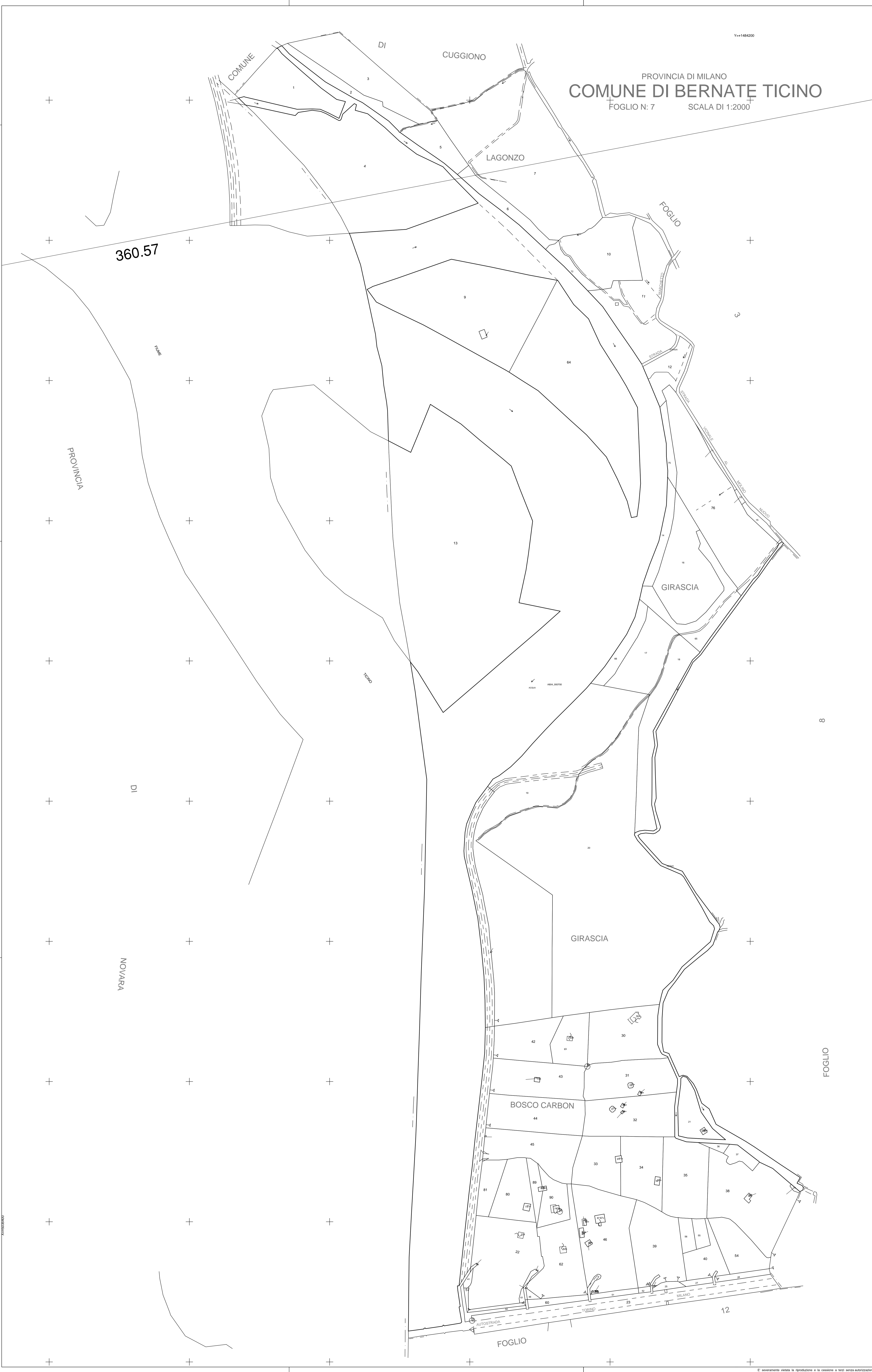
QUADRO D'UNIONE COMUNE