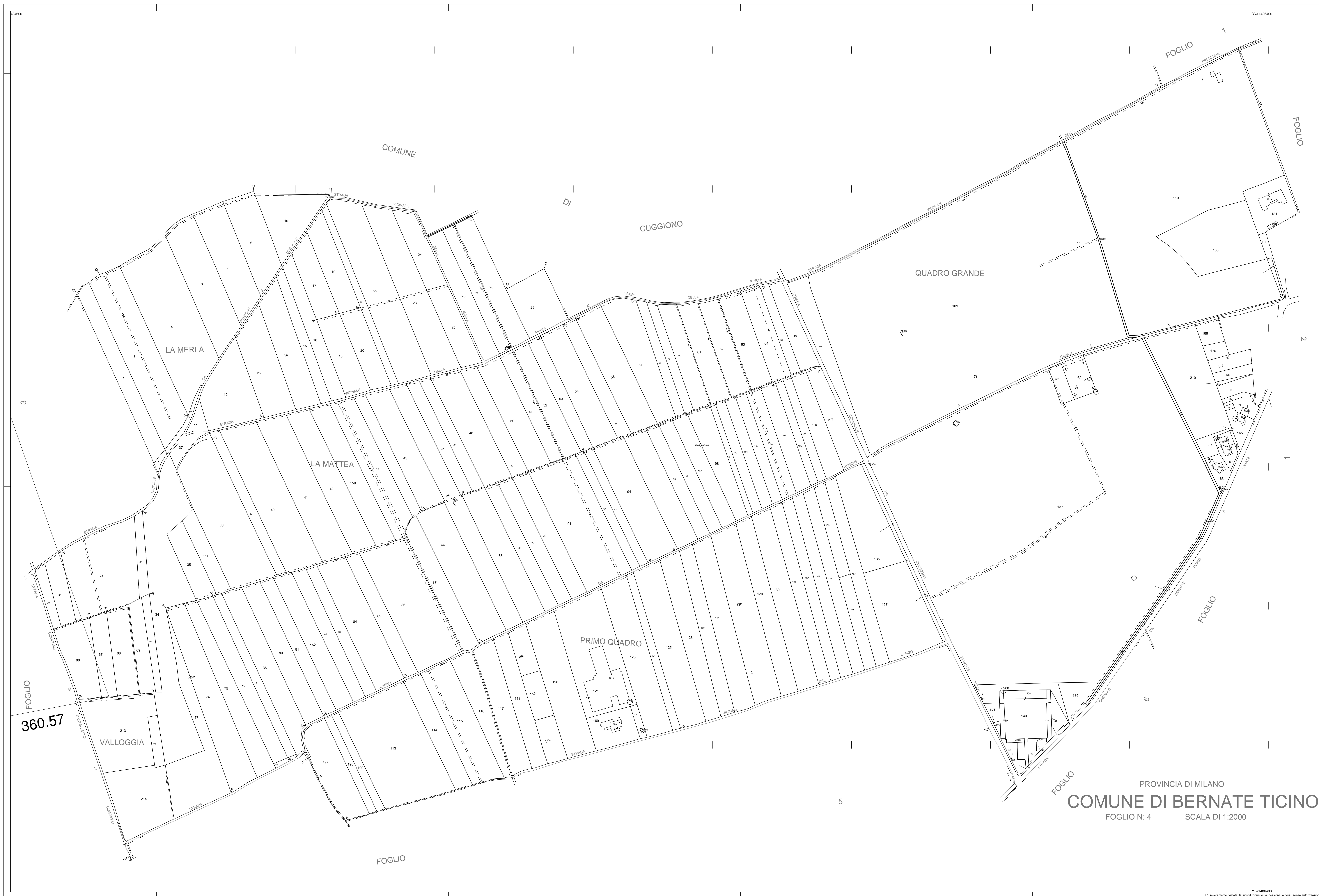
QUADRO D'UNIONE COMUNE