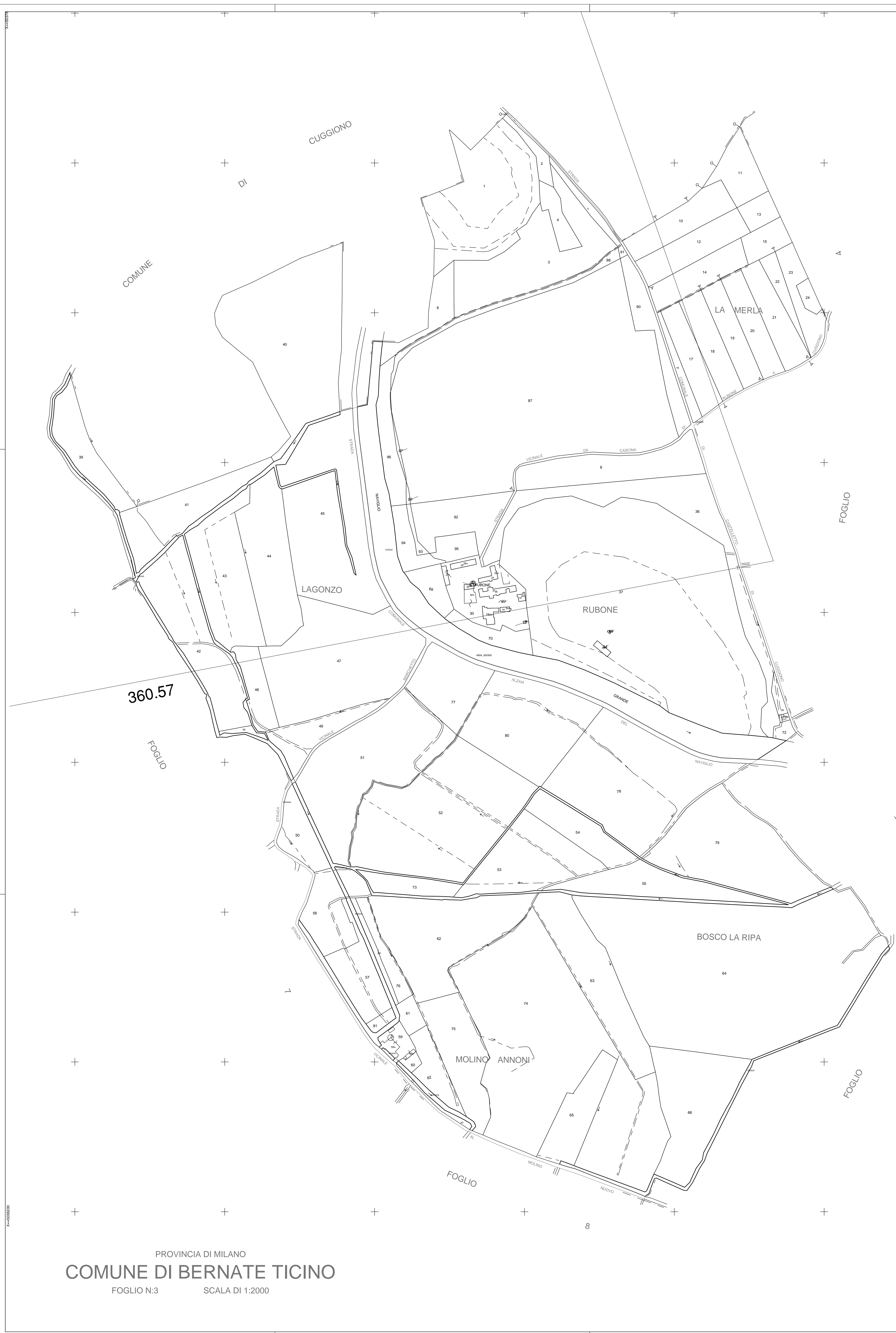
QUADRO D'UNIONE COMUNE